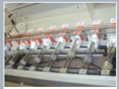
Sistema mecánico de transferencia. Confiable y silencioso.