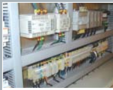
PLC y tablero eléctrico. Seguridad y Control.