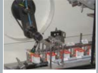
Innovador cabezal rotativo de carga de estuches con válvula mecánica de vacío. Estabilidad en alta velocidad.